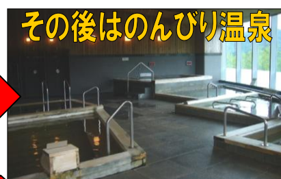
その後はのんびり温泉