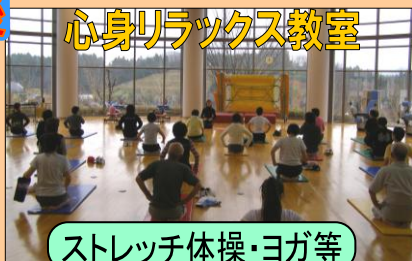
心身リラックス教室