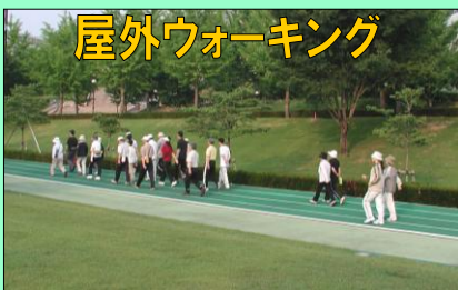
屋外ウォーキング