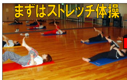
まずはストレッチ体操