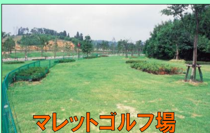
マレットゴルフ場