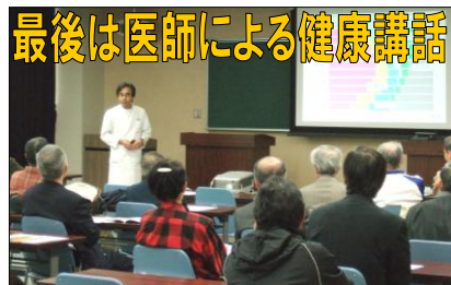
最後は医師による健康講話